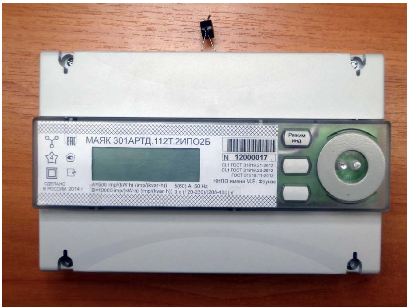
Рисунок 1 – Внешний вид счетчика с закрытыми крышками

Внешний вид счетчика МАЯК 301АРТД с закрытыми крышками приведен на рисунке 1.